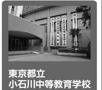
東京都立小石川中等教育学校

適性検査は、資料や図表を分析する力、論理を組み立てて自分の言葉で表現する力が求められます。小松講師によれば、「初めは自分の答のどこが悪いのかよくわからなかったのですが、先生が説明してくださったので最後までがんばりました。」と小松講師は話しています。