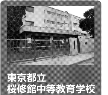
東京都立桜修館中等教育学校

取材を終えて。桜修館中等教育学校は東急東横線「都立大」徒歩10分、目黒区八雲の上にあります。