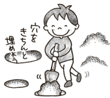
苦手分野も程度に応じて効率的に復習を!

苦手分野も程度に応じて効率的に復習を! 本気で苦手を克服するには、苦手分野の弱点を徹底的に復習することが大切です。