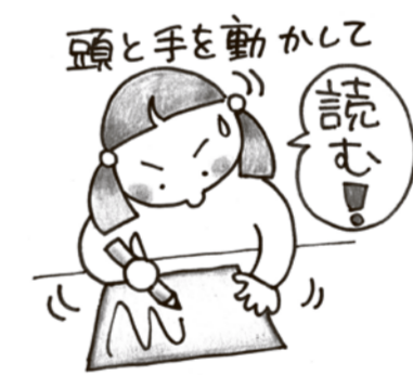
頭と手を動かして読む!