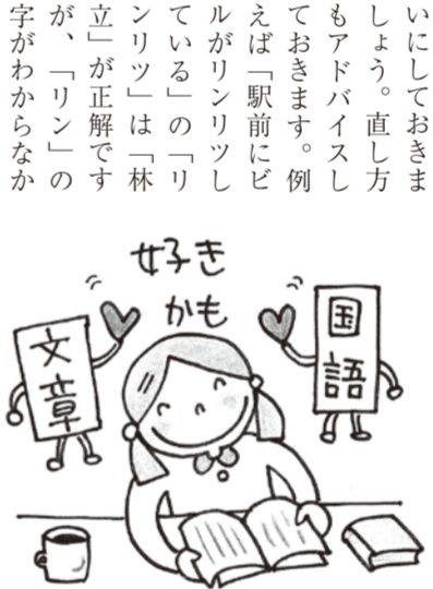
せきかも 文章 国語