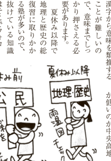
夏休みの公民と歴史の勉強

「公民の知識は時間をかけて意味まで完全に押さえる」といいますが、社会の勉強は、歴史と公民を1:1の比率で行うことが大切です。歴史を学ぶことで、公民の勉強がより理解しやすくなります。この夏に大きくステップアップできるよつ、ぜひ取り組んでみて下さい。